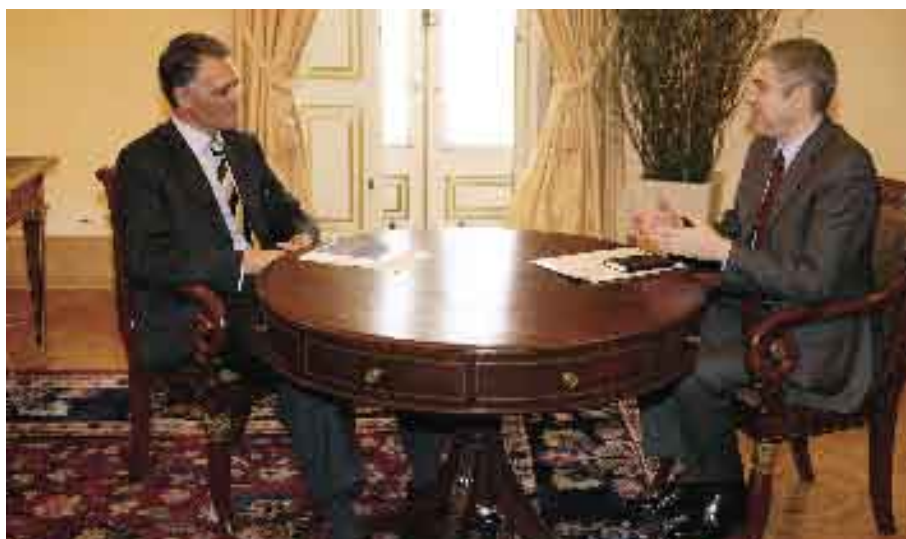
16 de Março de 2006. Primeira reunião com o Primeiro-Ministro.