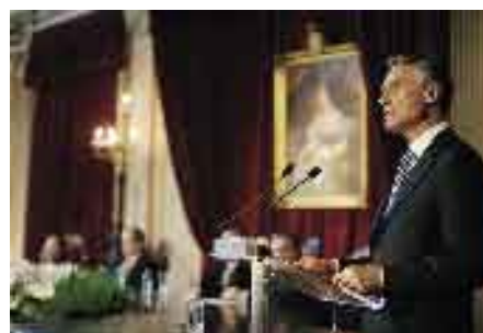
31 de Janeiro de 2007. Abertura do Ano Judicial.