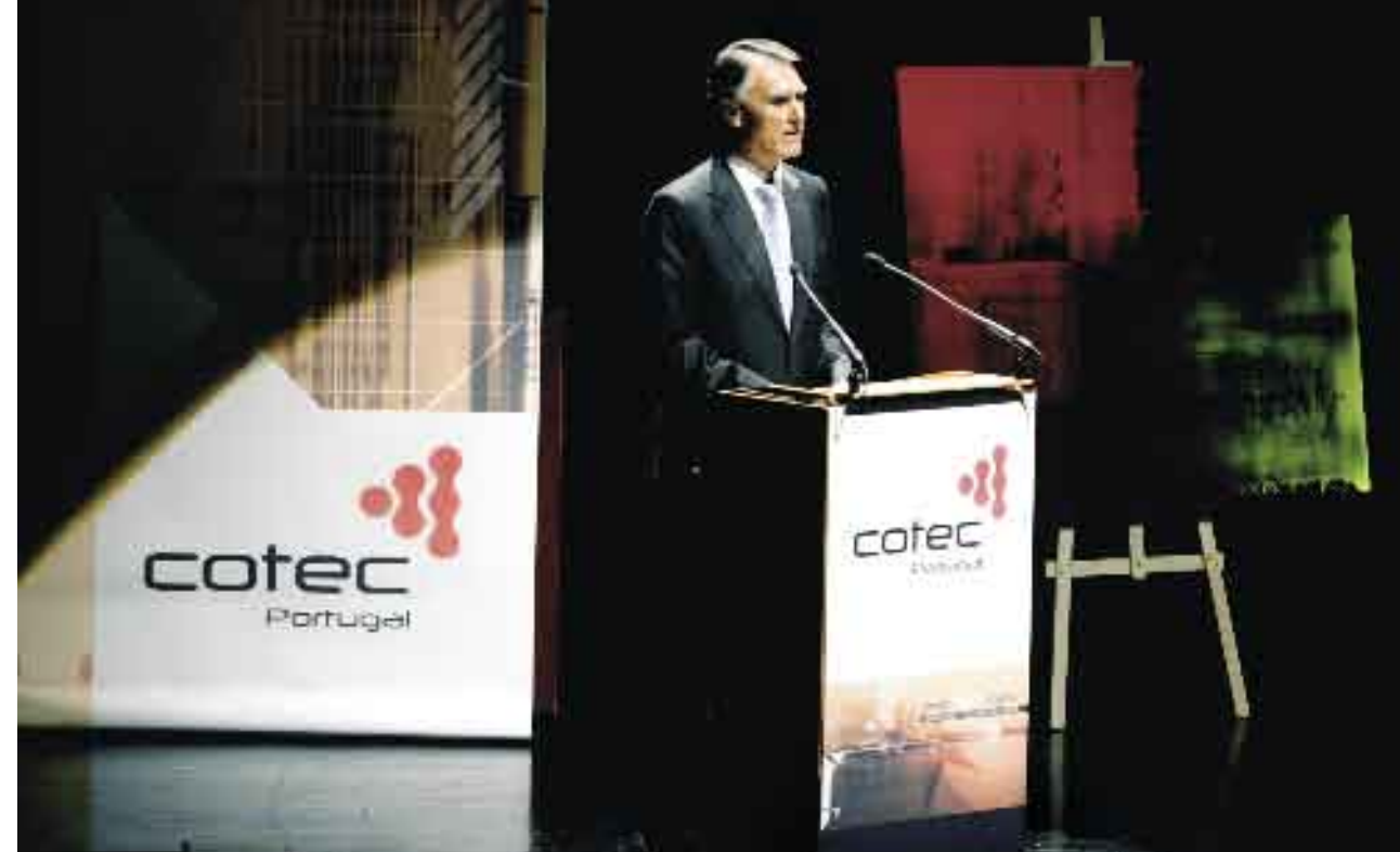
15 de Maio de 2006. Assembleia-Geral da COTEC.

em audiência, a Vice-Presidente do Governo espanhol, Maria Teresa Fernández de la Vega.