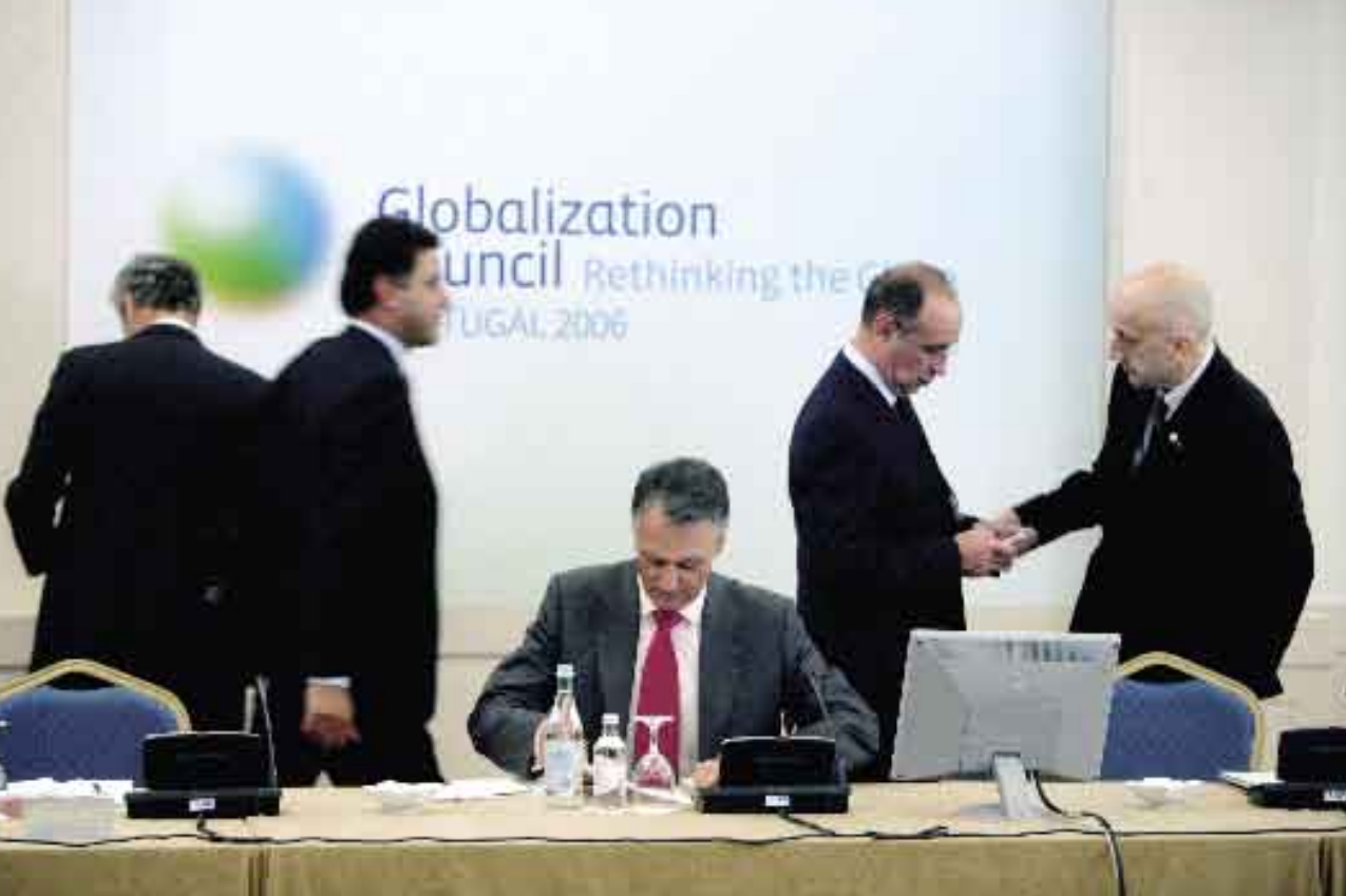
10 de Novembro de 2006. Encontro do Conselho para a Globalização.