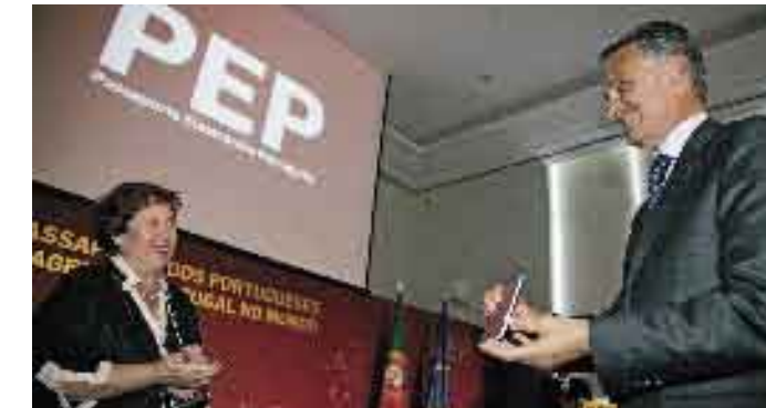
28 Agosto de 2006. Cerimónia da emissão do Passaporte Electrónico Português.

Dia 30 • O Presidente da República reúne o Conselho Superior de Defesa Nacional, em sessão extraordinária.