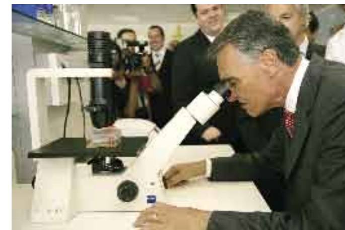
19 e 20 de Junho de 2006. Roteiro para a Ciência.