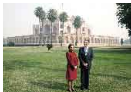
Visita de Estado à Índia.