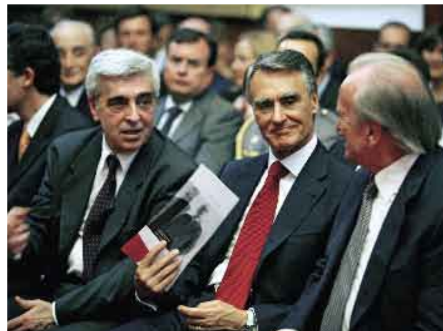
6 de Junho de 2006. Entrega do Prémio Pessoa 2005.

Dia 21 • O Presidente da República participa, na sede do Serviço Nacional de Bombeiros e Protecção Civil, em Carnaxide, numa reunião de trabalho