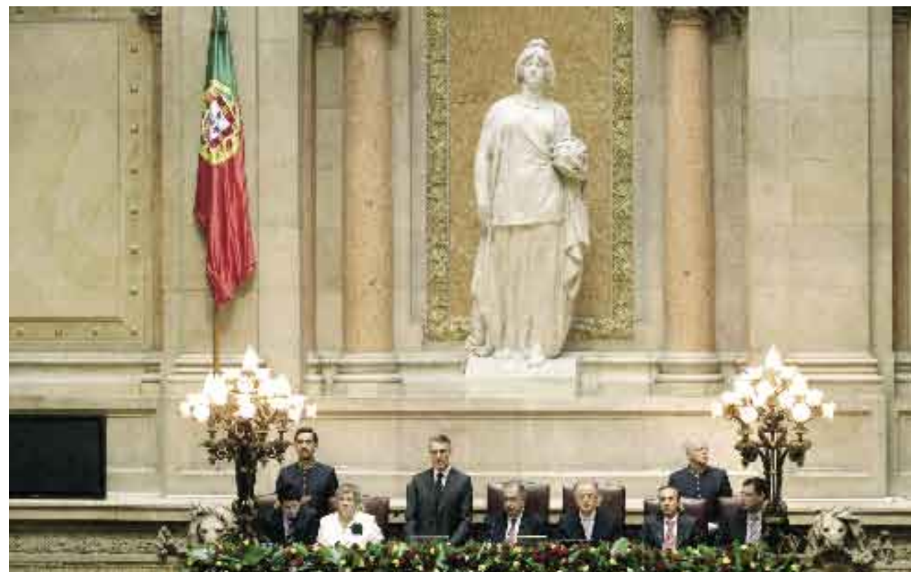
9 de Março de 2006. Tomada de Posse.