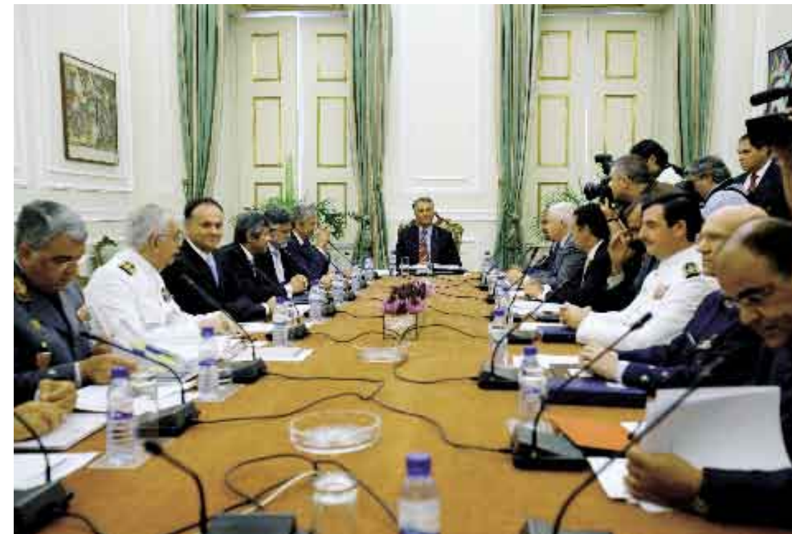
30 de Agosto de 2006. Reunião do Conselho Superior da Defesa Nacional.