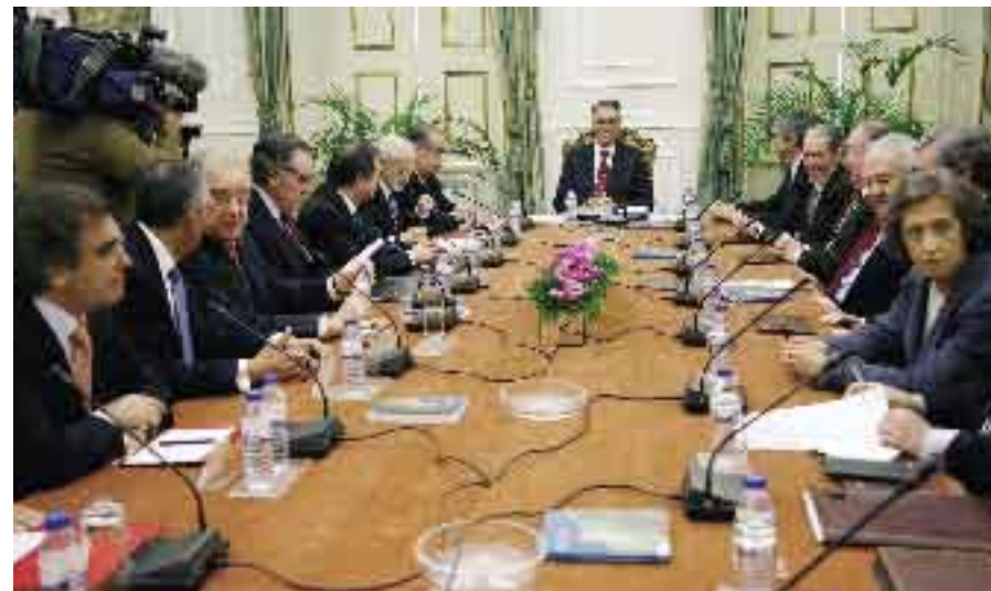
2 de Março de 2007. Reunião do Conselho de Estado.

• O Presidente da República recebe, em audiência, o anterior Vice-Presidente dos Estados Unidos, Al Gore.