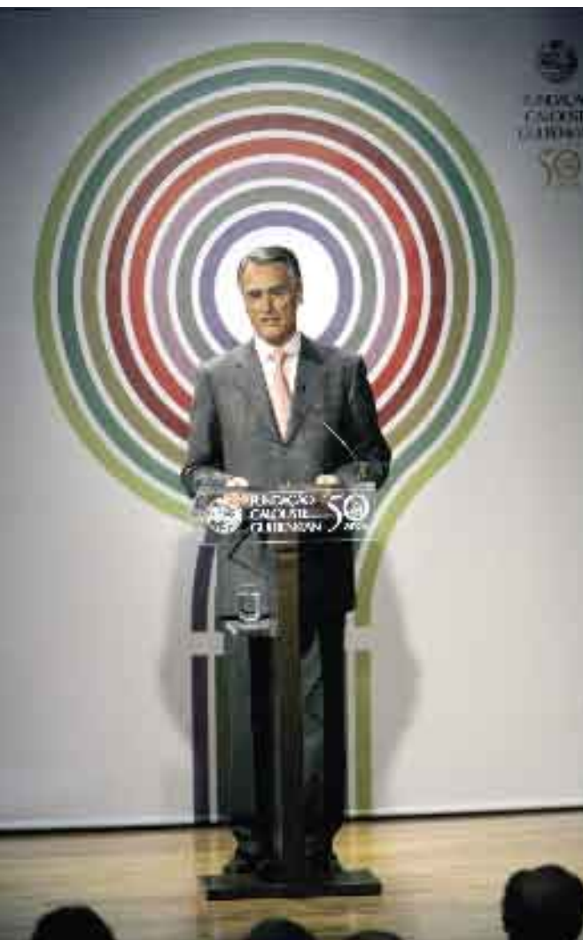
25 de Outubro de 2006. Conferência "Que valores para este tempo?", Fundação Calouste Gulbenkian.

Dia 17 • O Presidente da República participa na cerimónia de apresentação do Projecto ANAMNESE, da Fundação Ilídio Pinho, na Universidade Católica do Porto.