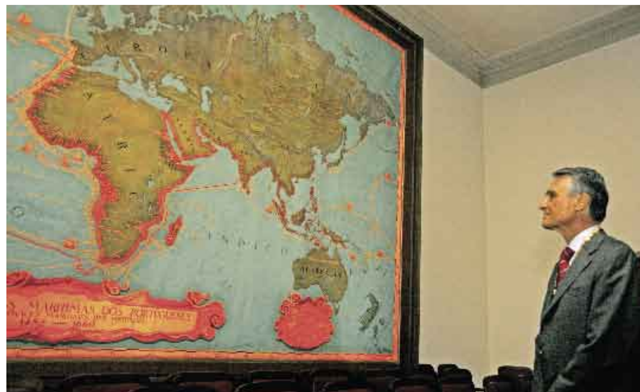
5 de Março de 2007. Visita à Sociedade de Geografia.