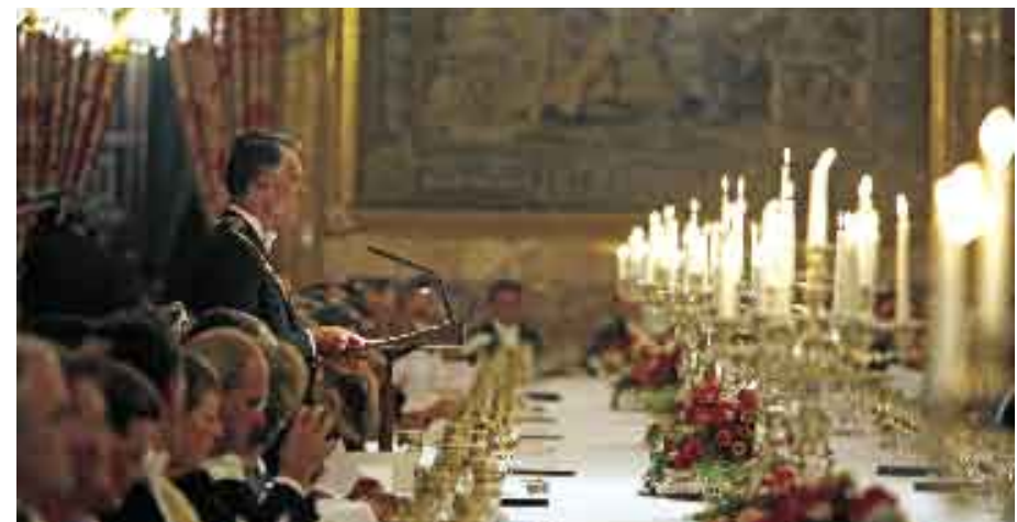
Visita de Estado a Espanha.