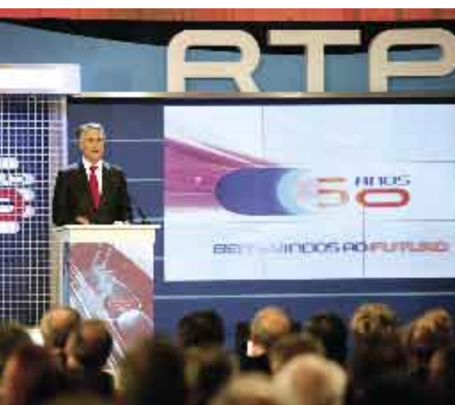
7 de Março de 2007. Comemorações dos 50 anos da RTP.