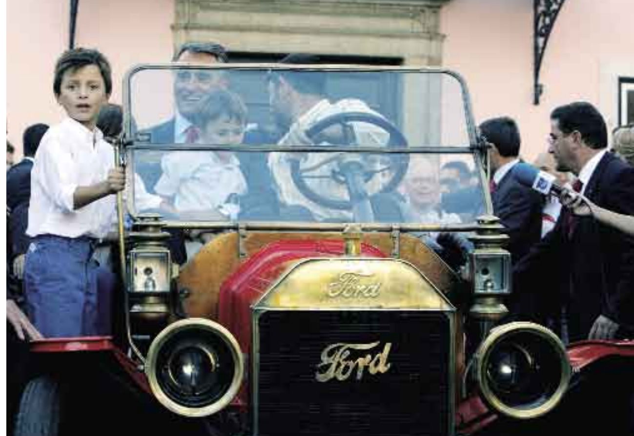
5 de Outubro de 2006. Comemorações da Proclamação da República.