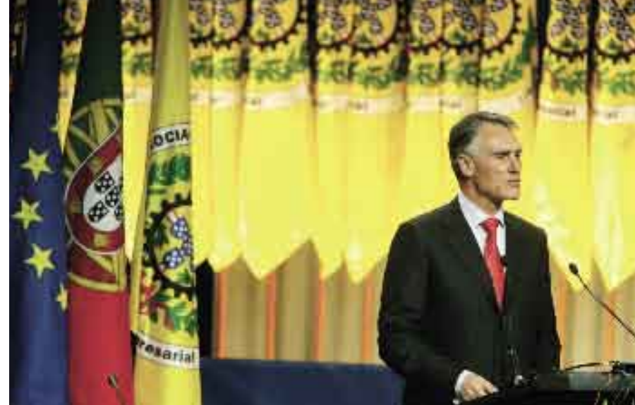
1 de Fevereiro de 2007. 170º aniversário da Associação Industrial Portuguesa.