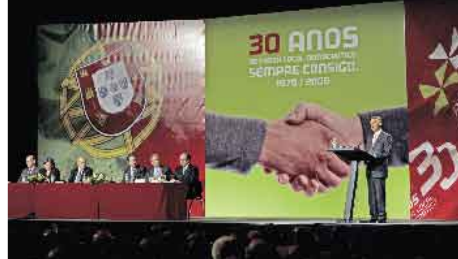
12 de Dezembro de 2006. Congresso do Poder Local.

Dia 28 • O Presidente da República participa na sessão solene de entrega do Prémio Literário Fernando Namora ao escritor Miguel Real, no Teatro Auditório do Casino Estoril.