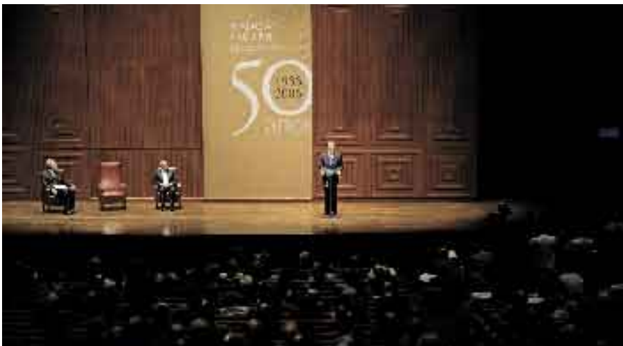
18 de Julho. Sessão Solene comemorativa do 50º aniversário da Fundação Calouste Gulbenkian.