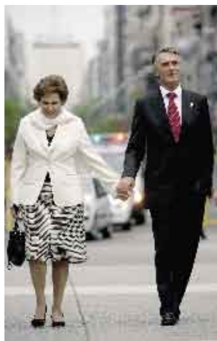
2 a 5 de Novembro de 2006. XVI Cimeira Ibero-Americana. Montevideo, Uruguai.