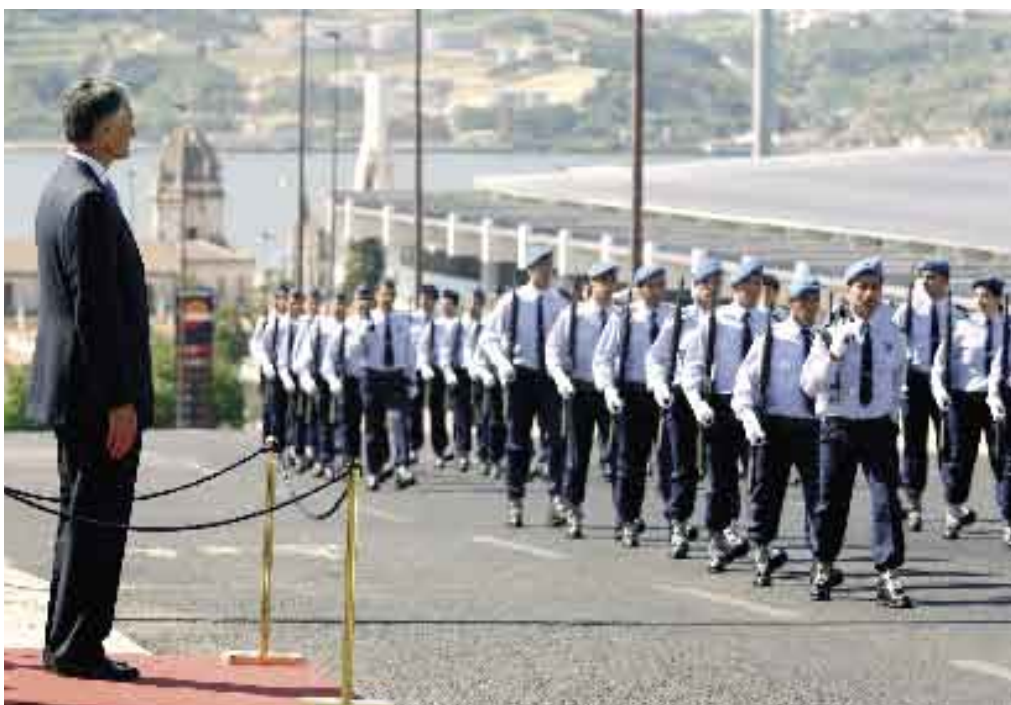
24 de Maio de 2006. Visita o Estado-Maior-General das Forças Armadas.