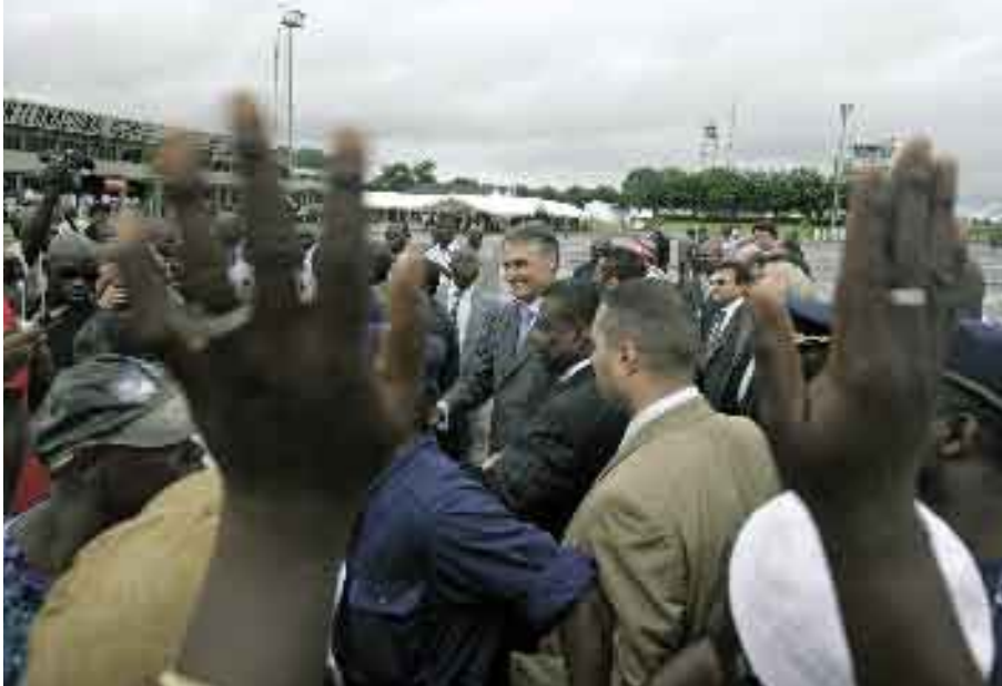
17 de Julho de 2006. Cimeira de Chefes de Estado e de Governo dos Estados-membros da Comunidade dos Países de Língua Portuguesa (CPLP).

Dia 18 • O Presidente da República participa na Sessão Solene comemorativa do 50º aniversário da Fundação Calouste Gulbenkian.