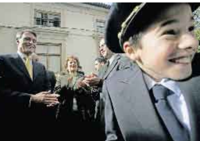
24 a 26 de Novembro de 2006. Deslocação aos Distritos de Bragança e Coimbra.

Dia 10 • O Presidente da República participa no primeiro Encontro do Conselho para a Globalização, ao qual preside.