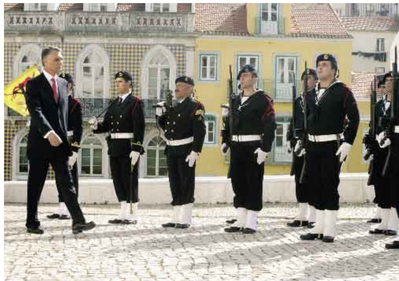
25 de Abril de 2006. Comemorações do 32º aniversário do 25 de Abril.