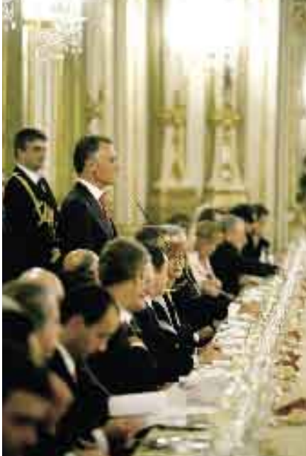
10 de Novembro de 2006. Conselho para a Globalização. Jantar.