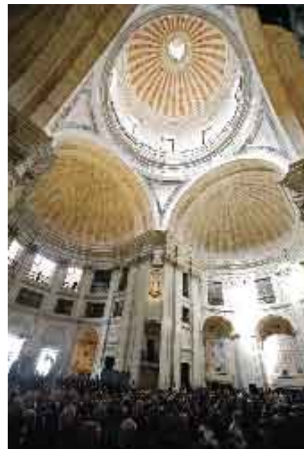
4 de Outubro de 2006. Encerramento das Comemorações do Centenário do Nascimento do General Humberto Delgado.