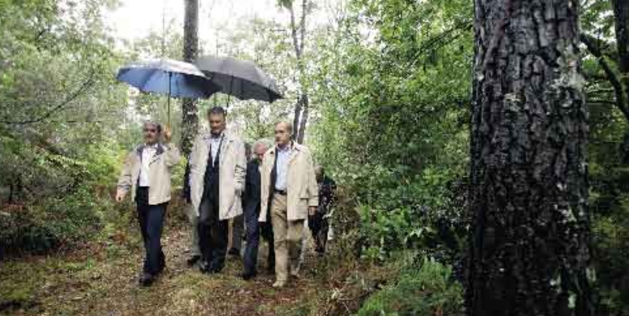
23 de Setembro de 2006. Visita ao Parque Nacional da Peneda-Gerês.