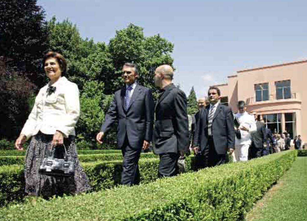
10 de Junho de 2006. Comemorações do Dia de Portugal, de Camões e das Comunidades Portuguesas.

para acompanhamento das actividades de Protecção Civil, designadamente em matéria de incêndios florestais.