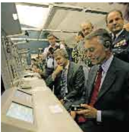
11 de Julho de 2006. Visita à Força Aérea.

Dia 03 • O Presidente da República confere posse aos novos membros do Governo, o Ministro de Estado e dos Negócios Estrangeiros, Dr. Luís Amado,