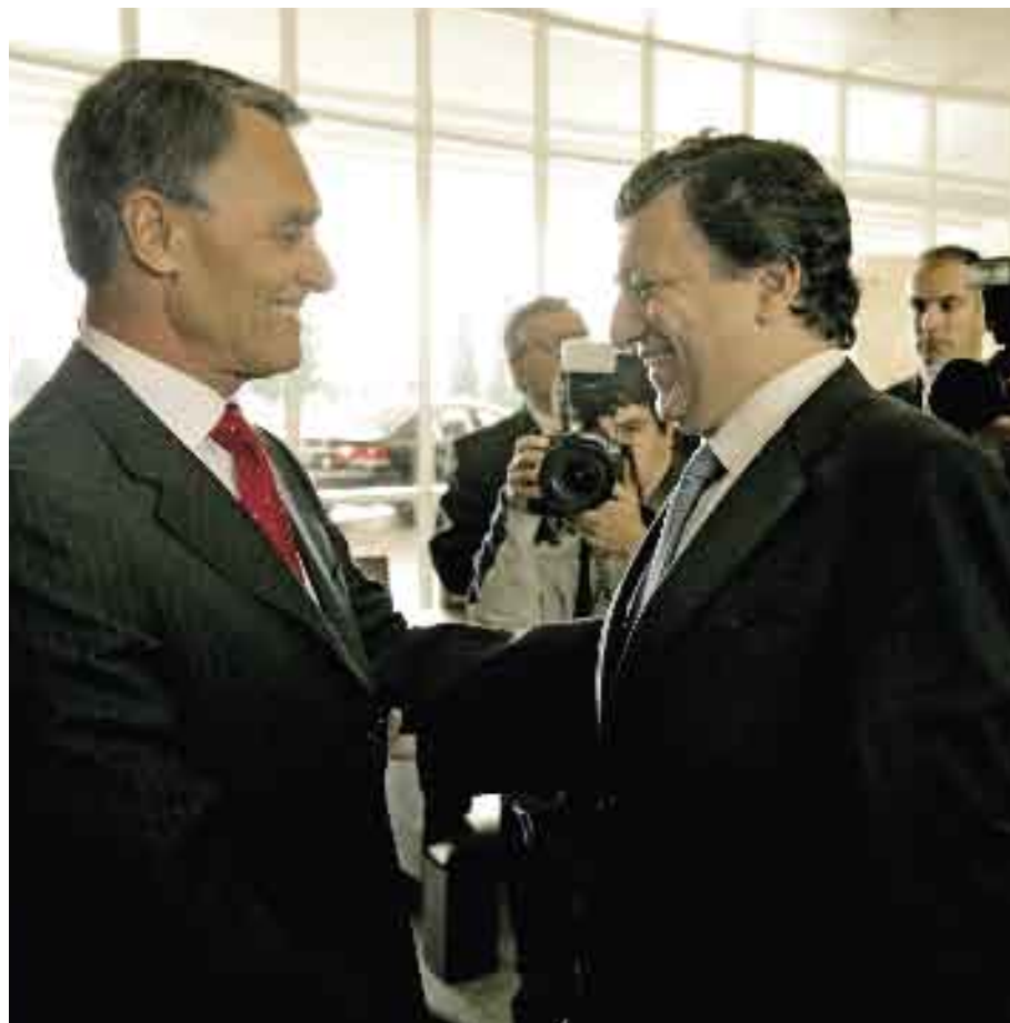
9 de Maio de 2006. Seminário “Dia da Europa 2006 - Portugal e o Futuro da Europa nos 20 anos da Adesão”.