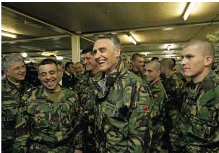
20 e 21 de Abril de 2006. Visita às Tropas Nacionais destacadas na Bósnia-Herzegovina e no Kosovo.

Dia 28 • O Presidente da República recebe, em audiência, o Presidente do Governo Regional da Madeira, Dr. Alberto João Jardim.