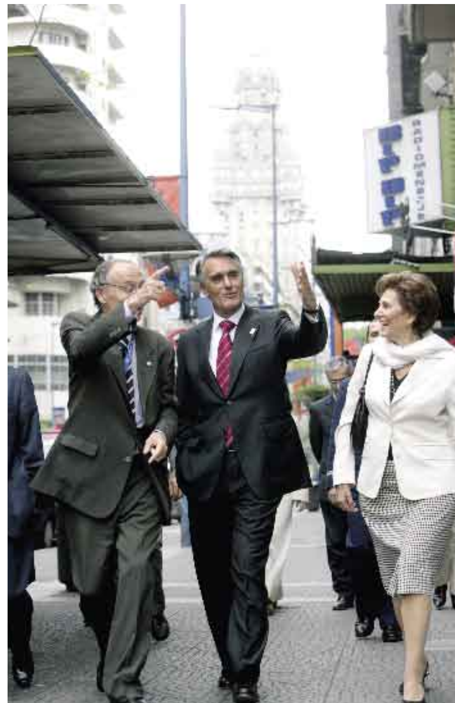
XVI Cimeira Ibero-Americana. Montevideo, Uruguai.