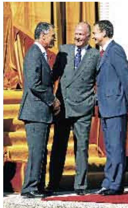
25 a 28 de Setembro de 2006. Visita de Estado a Espanha.

Dias 25 a 28 • Visita de Estado do Presidente da República e Dr.ª Maria Cavaco Silva ao Reino de Espanha.