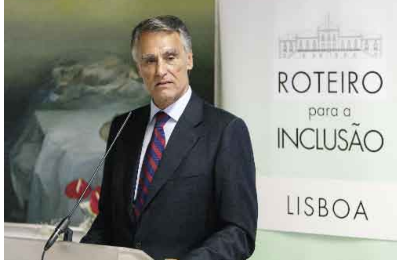
10 e 11 de Outubro de 2006. Roteiro para a Inclusão. 3ª Jornada.